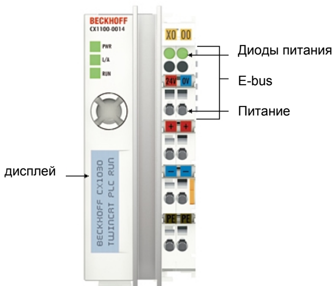
Блок питания с E-Bus интерфейсом

Блоки питания для Embedded ПК модели CX1030 существуют в трех исполнениях. К CX1100-0012 можно подключать линейку K-bus модулей типа (KLXXXX/KMXXXX), в дополнении к этому к CX1100-0013 можно еще подключать линейку модулей Fieldbusbox типа IExxxx. К CX1100-0012 можно подключать линейку E-bus модулей типа (ELXXXX).